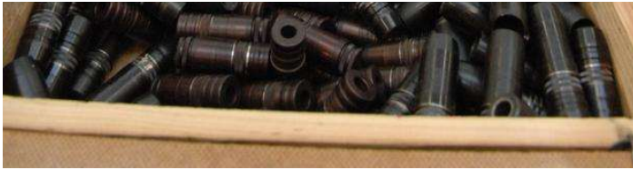
Artur Chmielewski / newsp